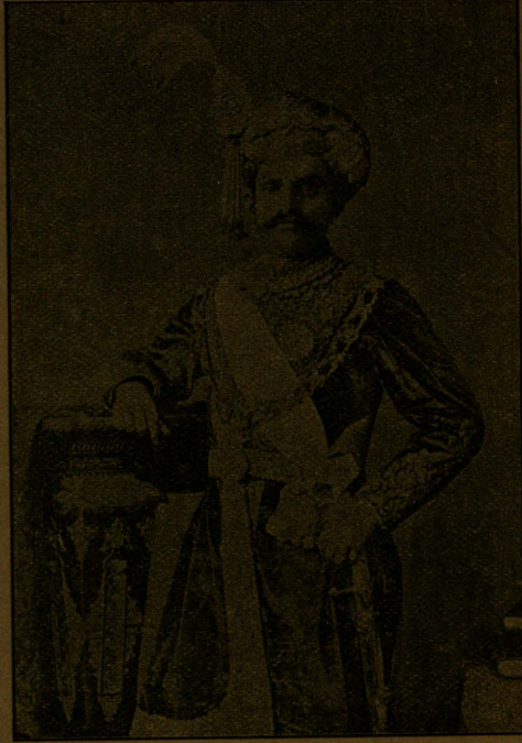
ಶ್ರೀಮನ್ಮಹಾರಾಜ ಶ್ರೀಚಾಮರಾಜೇಂದ್ರ ಒಡೆಯರವರು.

ಶ್ರೀಮನ್ಮಹಾರಾಜ ಶ್ರೀ ಚಾಮರಾಜೇಂದ್ರ ಒಡೆಯರವರು ಉತ್ತರದೇಶಸಂಚಾರ.